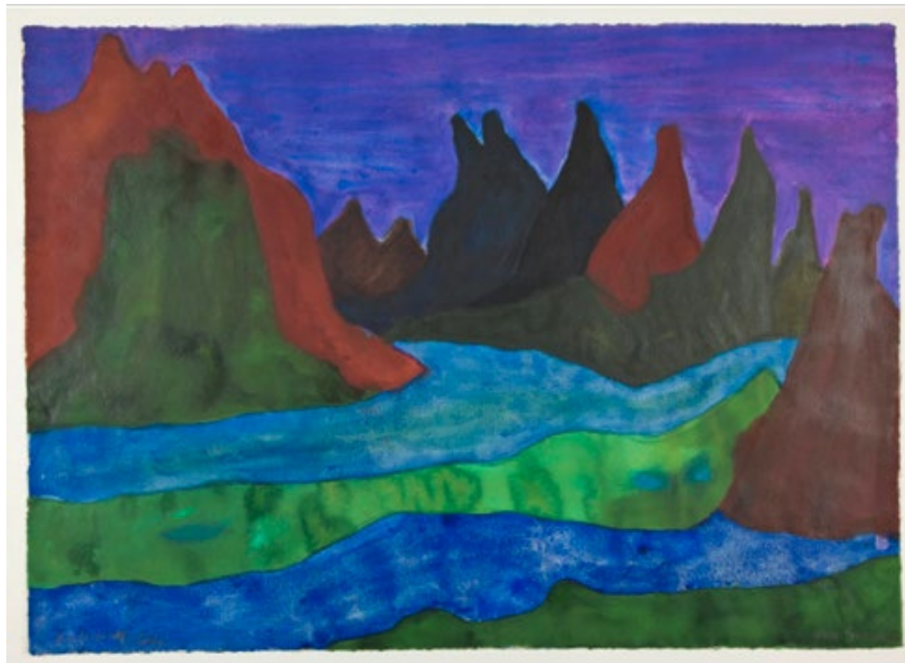
Hein Semke Møskenesoy (Lofoten) 1980