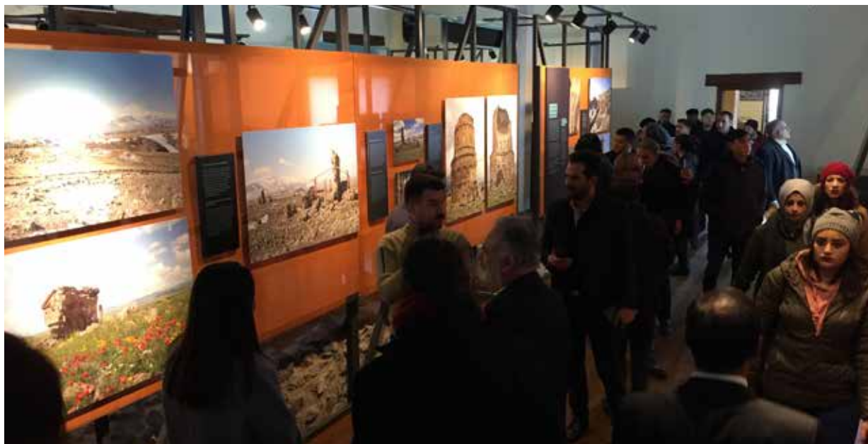
Անի քաղաքին նուիրուած ցուցահանդէս, Կարս, Թուրքիա 2022