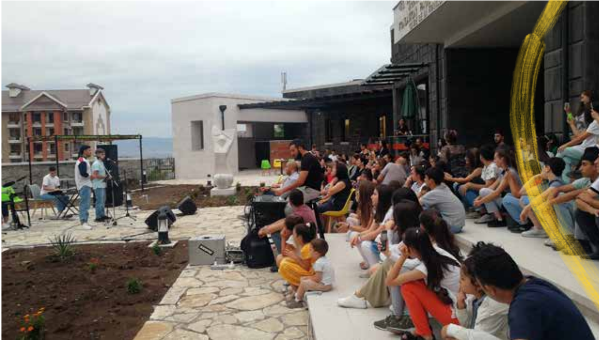
Ստեփանակերտի մէջ աշխատանոց, 2022

Հայկական Համայնքներու Բաժանմունքը Գալուստ Կիլպէնկեան Հիմնարկութեան նպաստատու բաժանմունքներէն մէկն է, որ կ'աշխատի երկու ուղղութեամբ. կ'օժանդակէ նախագիծերու եւ կը տրամադրէ համալսարանական կրթանպաստներ: