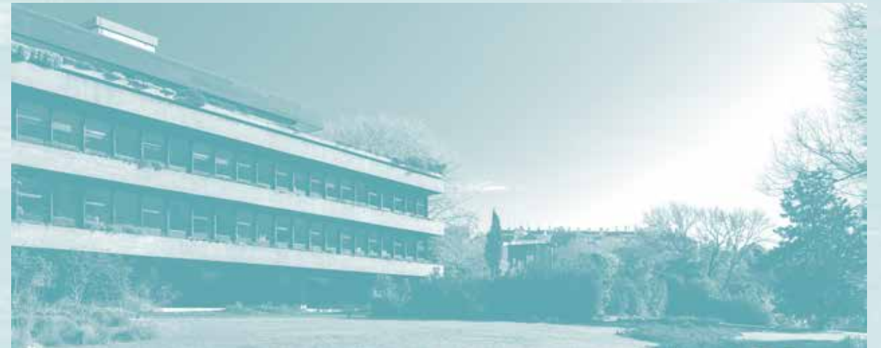
Գալուստ Կիլպէնկեան Հիմնարկութիւն

Ըստ Կիլպէնկեանի կտակին՝ 1956-ին Լիզպոնի մէջ կը հիմնուի Գալուստ Կիլպէնկեան Հիմնարկութիւնը, որ մինչ օրս կը կատարէ բարեգործական աշխատանքներ՝ արուեստի, կրթութեան եւ գիտութեան ոլորտներուն մէջ: