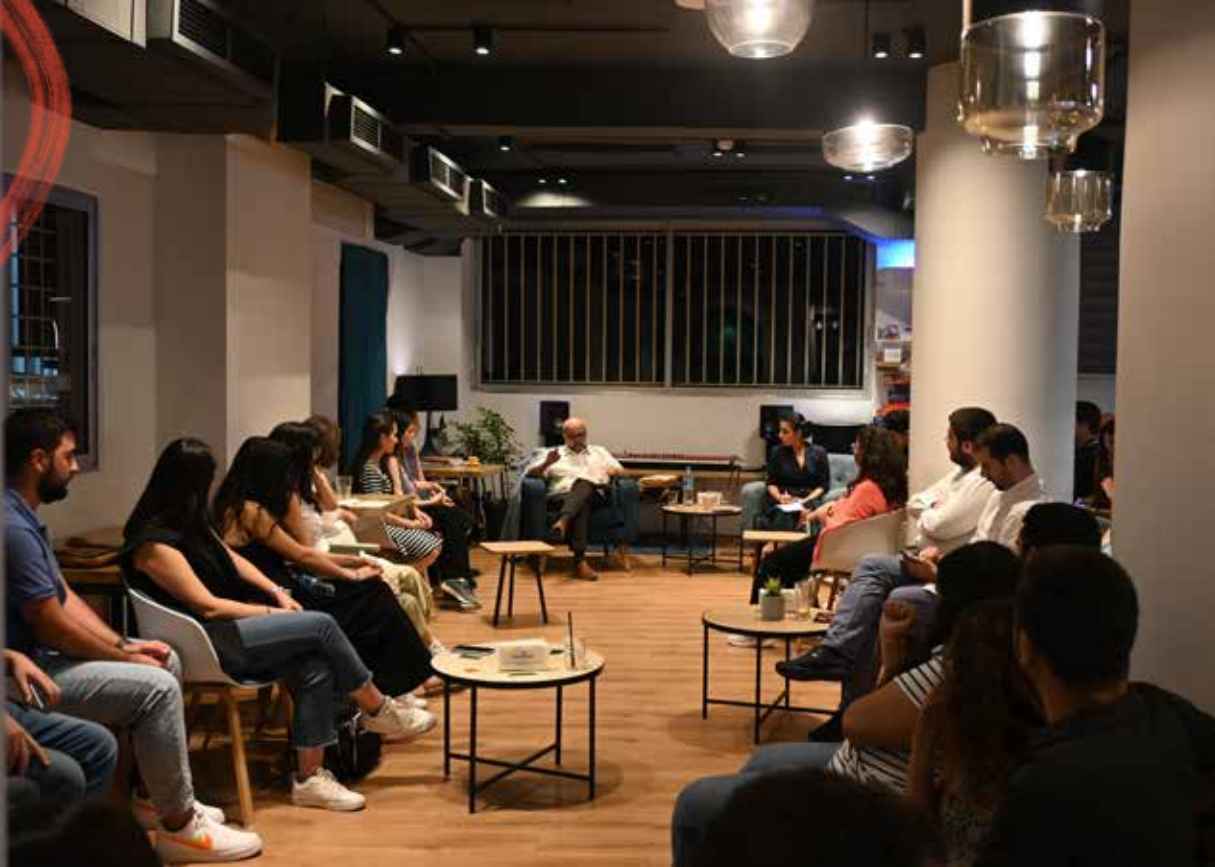
Երիտասարդներու հետ զրոյց, Պէյրութ, Լիբանան 2023

Հետեւաբար, Սփիւռքի մէջ կեդրոնացումը արեւմտահայերէնի եւ մշակութային ստեղծագործութեան վրայ է, իսկ Հայաստանի մէջ՝ հետազօտութիւններու, թարգմանութիւններու, ինչպէս նաեւ քննական մտքի զարգացումին վրայ: